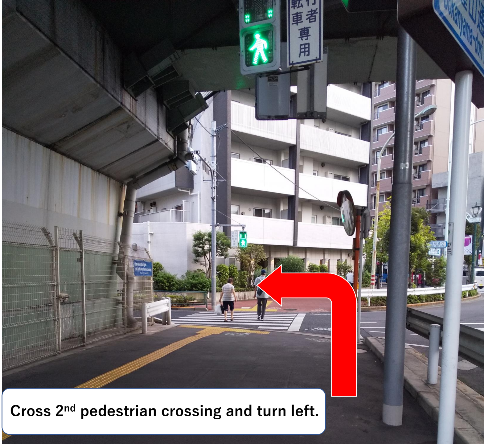
Cross 2 nd pedestrian crossing and turn left.