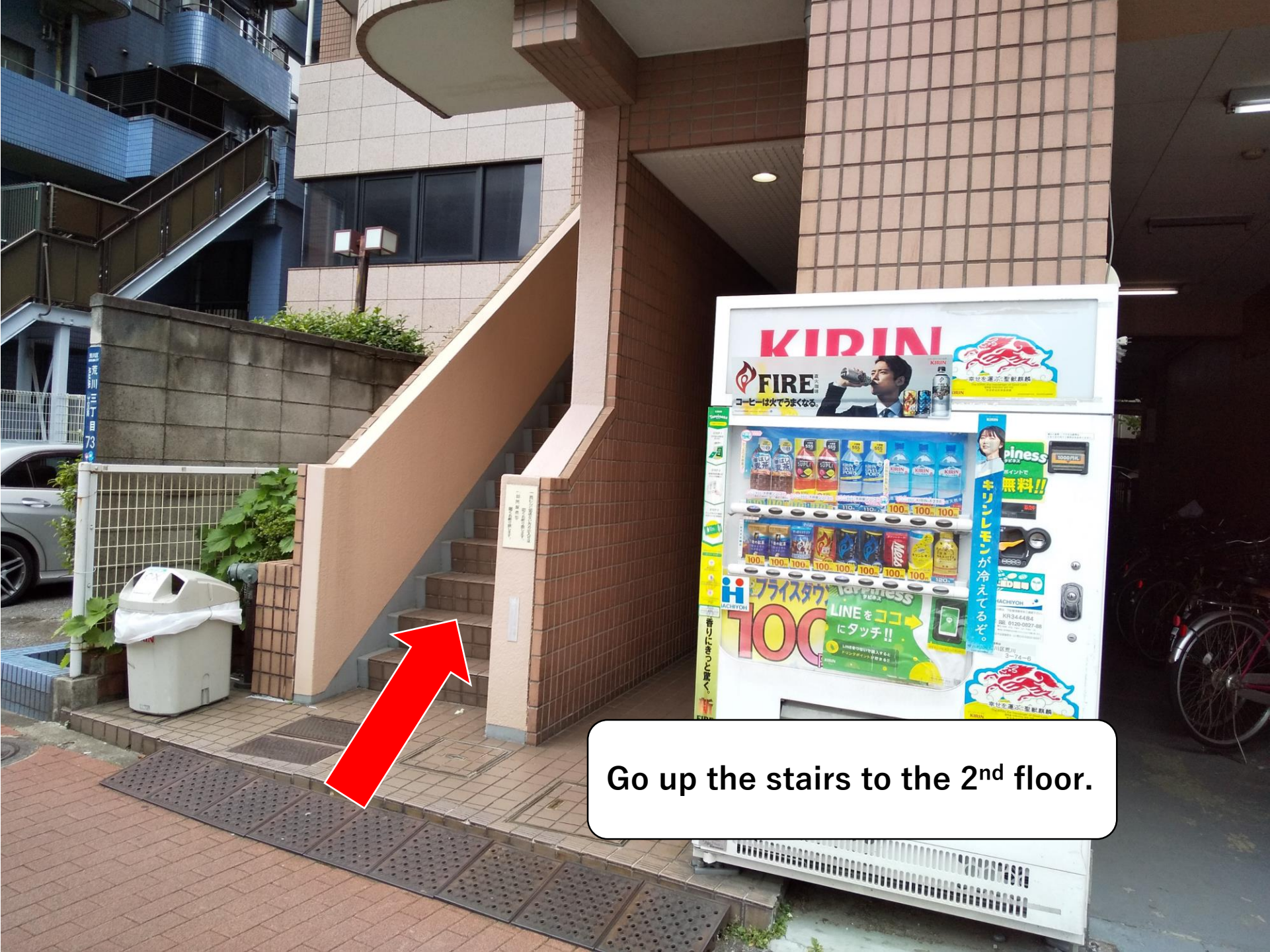
Go up the stairs to the 2 nd floor.