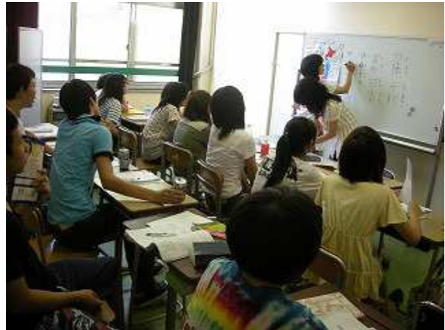
たぶんかフリースクール授業風景

日本の中学校に入れず、学ぶ場や居場所のない子どもたち（学齢超過生と中学卒業者）や、来日期間が浅く日本語の初期指導が必要な子どもたちに対して、毎日通えて日本語と教科を勉強できる学びの場と居場所を提供し、最終的には高校進学につなげることを目的とし実施した。また、不就学や不登校の子どもたちを公立学校就学へ繋げるための「虹の架け橋事業（定住外国人の子どもへの就学支援事業）」（※以下「虹の架け橋教室」）も実施した。