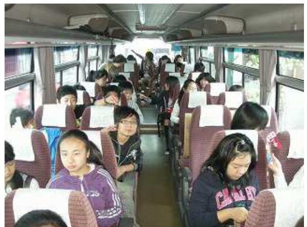
社会見学・バス内の風景

Gapジャパンの支援により、フリースクール生と講師ら28名が参加し、池袋「がんばれ！子供村」にてカラオケの交流会を行った。